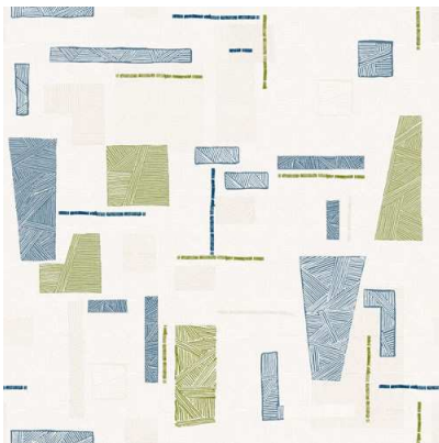
Esempio di tovaglia

L'espressione creativa può essere eseguita nelle seguenti indicazioni tecniche per tovaglia 100 x 100 :