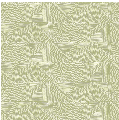
Esempio di tovagliolo