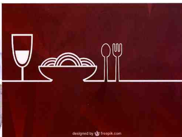
designed by freepik.com