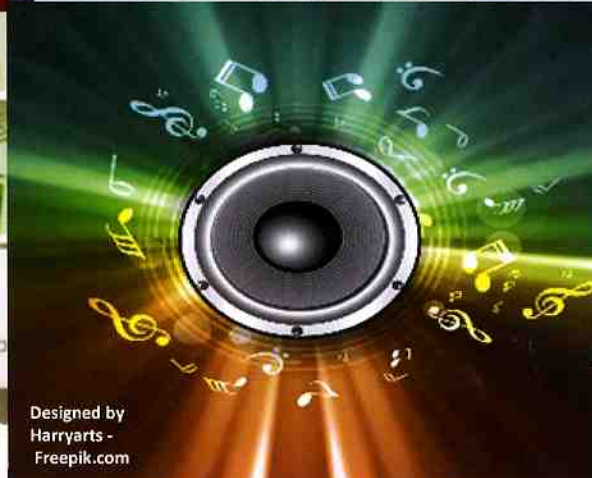
Designed by Harryarts - Freepik.com