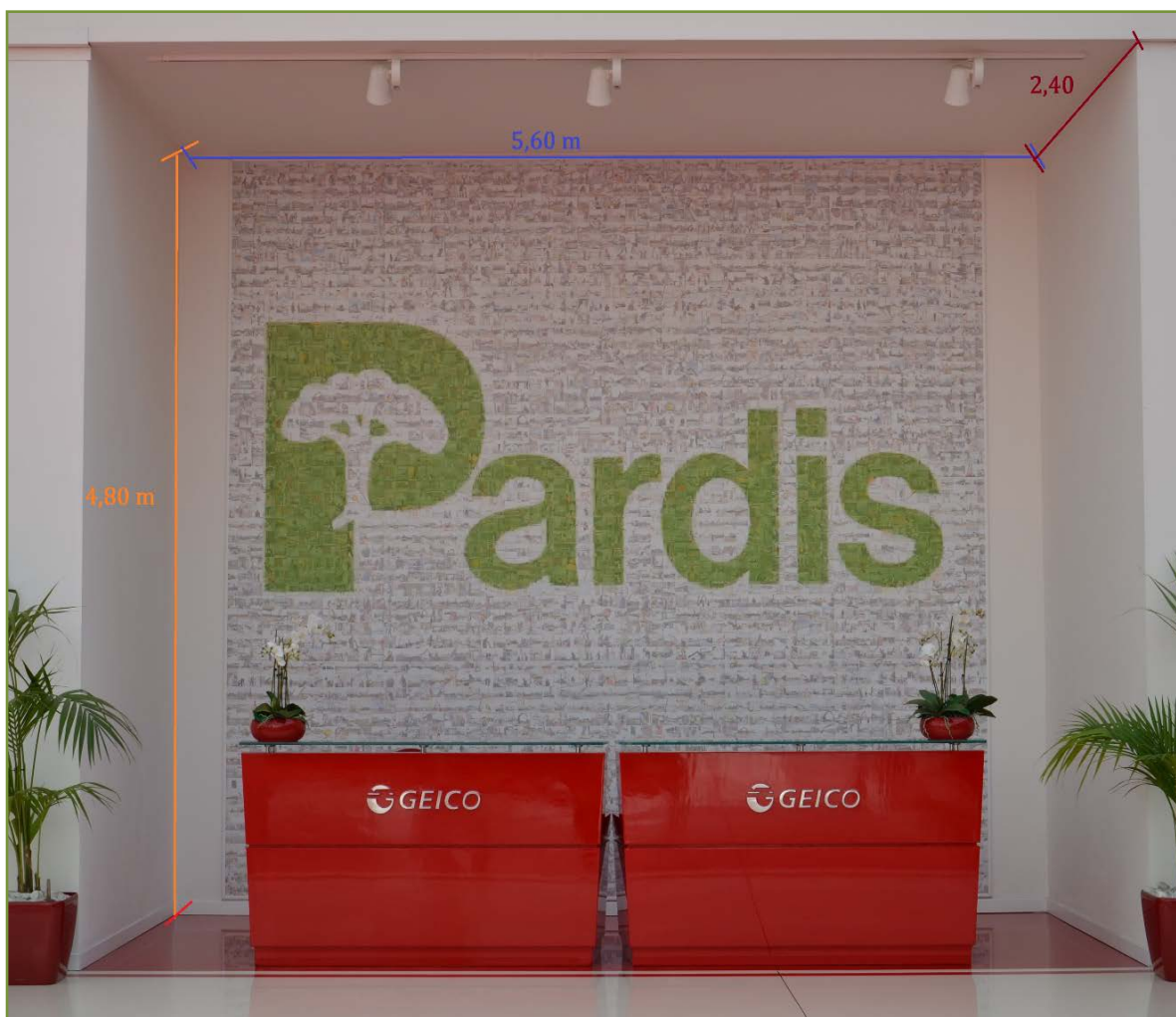
Figura 1 – Spazio Espositivo da riprogettare

Ricordiamo che la partecipazione all'evento è obbligatoria al fine di comprendere al meglio l'azienda e l'obiettivo del concorso.