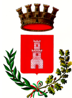
Comune di Grado